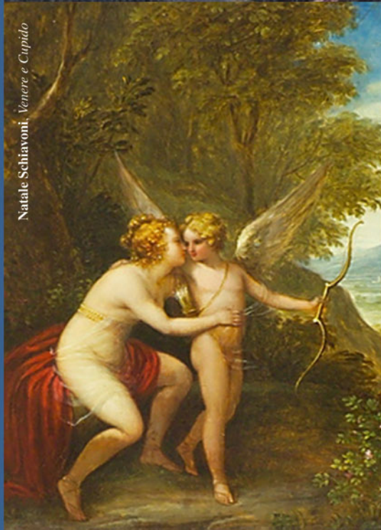
Natale Schiavoni, Venere e Cupido

24th December 1860. Their Imperial Highnesses the Serene Archduke and Archduchess Charlotte left the Gartenhaus and took possession of their apartments in Miramare Castle. At 5.30 p.m. dinner; at 7 Christmas tree gifts' distribution; play in the Archduchess' rooms; at midnight Christmas Mass with total lighting of Castle's Chapel.