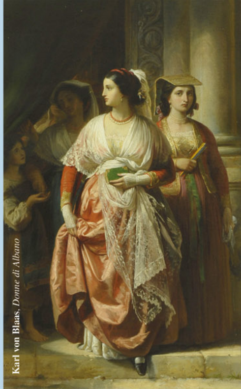
Karl von Blaas, Donne di Albano